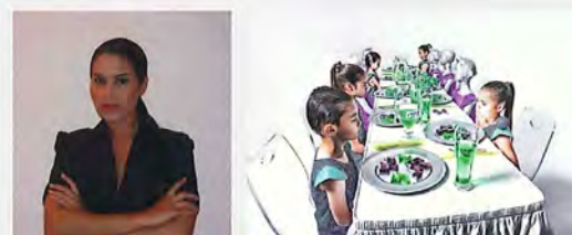
Lorna Otero Children of Tomorrow 2, Dinner (2010) Fotografía digital 40" x 60"