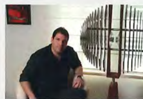
Néstor Paoli Imagine (2012) PVC Espumado, acrílico sobre canvas y acero inoxidable 15" x 60"