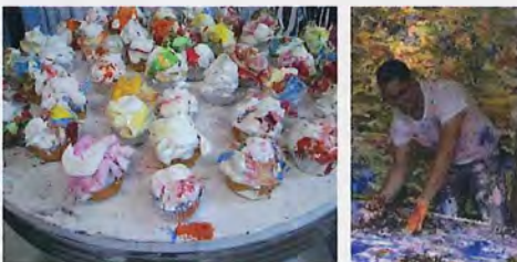
Melvin Martínez Cup Cakes Treats! (2012) Medio mixto Dimensiones variables