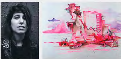
Sofía Maldonado Una ciudad en destrucción: La construcción fantasma (2011) Acrílico y gouache sobre papel de algodón 10.23" X 14.17"