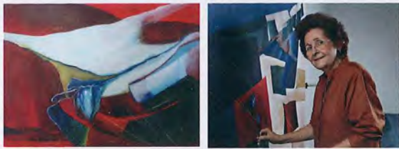
Noemí Ruiz Remembranzas (2012) Acrílico 24 3/4" x 10"