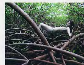
Nina Méndez Martí Renacimiento (2009) C-Print 16" x 24"