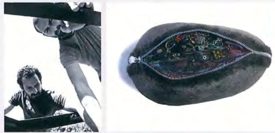
Jaime y Javier Suárez Berrocal (Vientre Compartido) Aparato (2012) Piedra, metal, tela, pelo, resina y pintura acrílica 5 1/4" x 10 1/2" x 6"