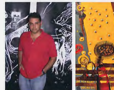
Jaime Romano Impromptu IV (2011) Pastel de óleo sobre papel Arches de acuarela 15 1/4" x 21 1/4"