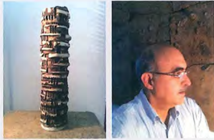
Jaime Suárez ... de las Torres de Babel III (2011) Cerámica 25" alto / 6" diámetro